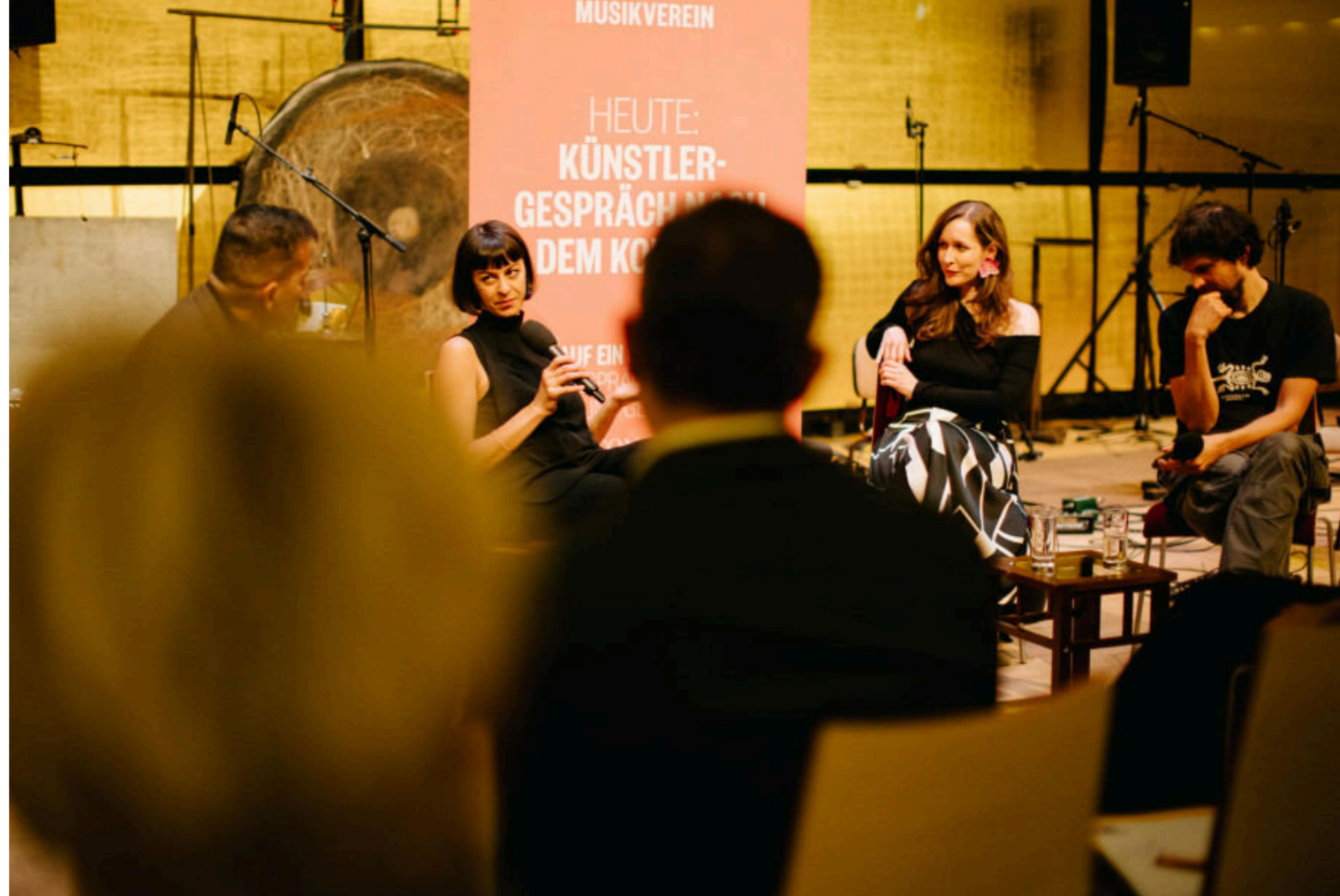
Artist talk nakon koncerta Black Page Orchestra, festival Wien Modern / Foto: Igor Ripak/Glazba.hr

I da za kraj malo promijenimo perspektivu – od tehnologije prema mašti: kad bi tvoje skladbe bile pejzaži, kakvi bi oni bili: morski, urbani, digitalni ili neki posve drugi?