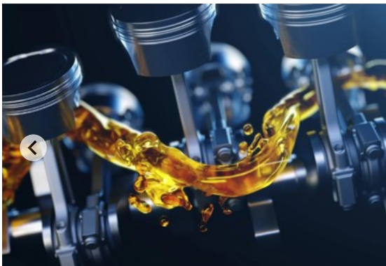
Datacol aditivi za gorivo